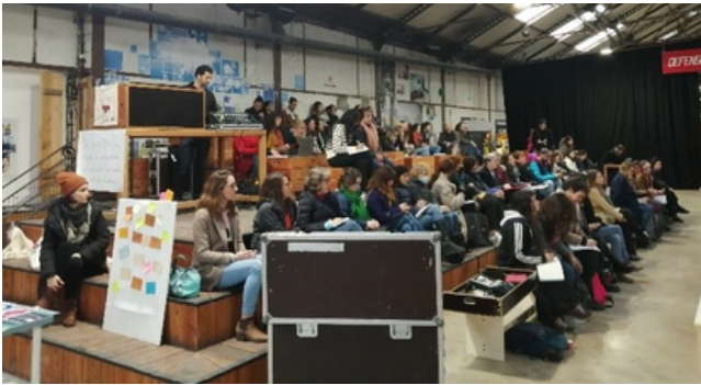
Journée d'étude inter-professionnelle - 14 mars 2022

62 rencontres partenariales et/ou réseau auxquelles a participé l'équipe-projet, avec notamment l'organisation d'une journée d'étude et de sensibilisation co-construite avec Médecins du Monde, le SIAO et Accueil Santé Béziers, qui a réuni environ 60 personnes.