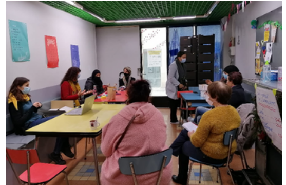
Animation à l'Esperluette (Celleneuve)