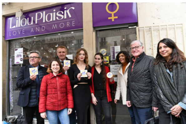
La distribution des stickers s'est faite en présence de plusieurs élus de Montpellier, de la CCI et du Planning Familial de l'Hérault.

53 personnes (30 femmes, 23 hommes) font déjà partie du dispositif. Objectif de 100 pour 2023.